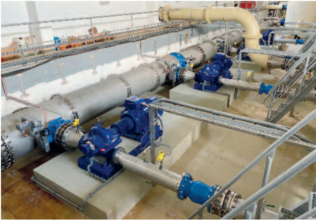
Im Wasserwerk Fichtenberg wurden in den Jahren 2019/2020 die Reinwasserpumpen und der Saugkollektor erneuert. 2020 erfolgt die letzte Teilmaßnahme als „Los 5“.

Im Wasserwerk Fichtenberg in der Stadt Mühlberg wurde im Jahr 2019 mit dem Umbau des Saugkollektors für die Reinwasserpumpen begonnen. 2020 soll mit dem Los 5 die planmäßige Weiterführung sowie der Abschluss der Maßnahme erfolgen. Dieses Los umfasst den Rückbau des erdverlegten „Altkollektors“, den Abriss eines Schachtes, den Verschluss von fünf Wanddurchführungen unterschiedlicher Dimensionen sowie die Rückumbindung der abgehenden Trinkwasserfernleitung DN 800, wobei ein während der Bauzeit installiertes Provisorium beseitigt wird. Diese Maßnahme kostet voraussichtlich 60.000 Euro.