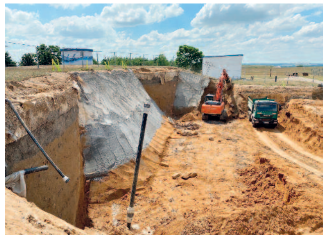
Die Arbeiten zum Neubau des Bediengebäudes am Hochbehälter Weida sind in vollem Gange. Die Fertigstellung ist für nächstes Jahr vorgesehen.

Investiert werden hier rund 2,1 Mio. Euro.