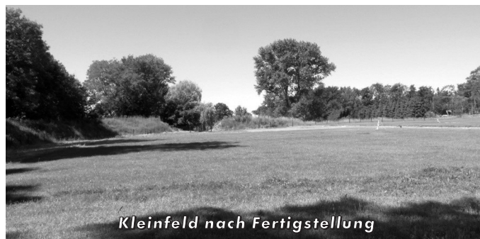
Kleinfeld nach Fertigstellung

Im Ergebnis dieser intensiven Rasenflächenbearbeitung ist die Bepflanzbarkeit der beiden Fußballfelder bei guter Unterhaltspflege des Vereins sowohl für den Nachwuchs als auch für die Jugend und die Senioren langfristig gesichert. Die Herstellung und Wiederherstellung der Sportplatzflächen, die die Mitglieder des Sportvereins detailliert mitbestimmt haben, tragen sehr zur Stärkung des Vereinslebens in der Gemeinde Glaubitz bei.