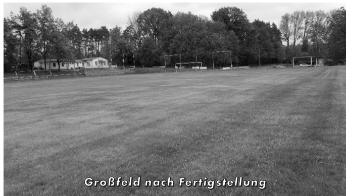
Großfeld nach Fertigstellung

Die Realisierung dieser Gesamtleistung wurde möglich durch die Zuwendung von Fördermittel lt. Schreiben des Landratsamtes vom 06.12.2018 mit einem bestätigten Fördersatz in Höhe von 80 % der zuwendungsfähigen Kosten. Das Projekt wurde durch die Leader-Förderung im Elbe-Röder-Dreieck unterstützt.