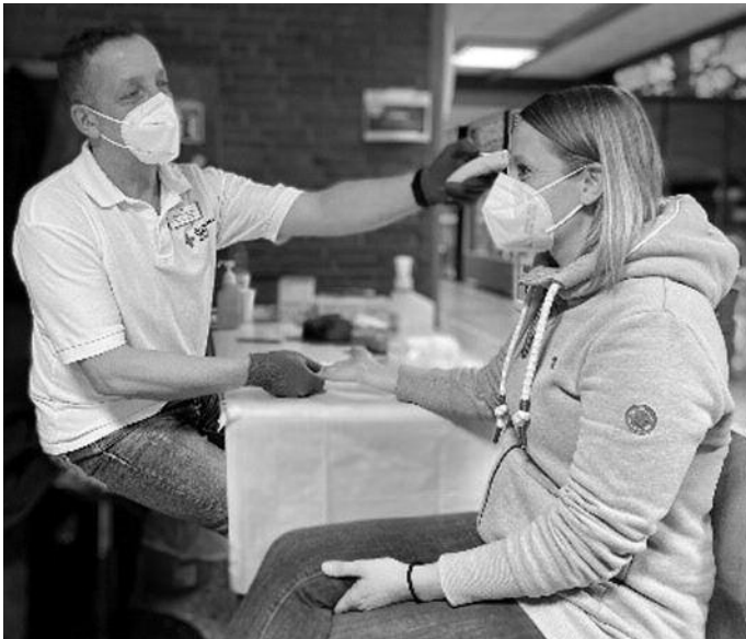
DRK-Blutspende unter Pandemiebedingungen. Hier: Messung des HB-Wertes vor der Blutentnahme.

Seit einigen Monaten werden diese und viele weitere Fragen im digitalen Blutspende-Magazin des DRK-Blutspendedienstes Nord-Ost unter https://magazin.blutspende.de/ beantwortet. Gut verständlich erhalten die Leserinnen und Leser interessante Einblicke hinter die Kulissen der DRK-Blutspendedienste, erfahren unter anderem genau, was mit dem Spenderblut nach der Blutspende passiert oder können selbst Themen vorschlagen. Wer sich für das Blutspenden beim DRK interessiert, sollte unbedingt mal reinklicken. Außerdem ist eine Terminreservierung für alle DRK-Blutspende-Termine erforderlich. Sie kann unter https://terminreservierung.blutspende-nordost.de/ erfolgen oder auch über die kostenlose Hotline 0800 11 949 11. Die Vorab-Buchung von festen Spendezeiten dient dem reibungslosen Ablauf unter Einhaltung aller aktuell geltenden Hygiene- und Abstandsregeln.