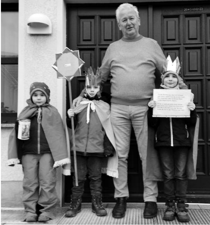
Sternsingen beim Glaubitzer Bürgermeister.

Zum Jahreswechsel waren sie wieder ohne Einschränkungen unterwegs: Kinder verkleidet als die drei Könige aus der Weihnachtsgeschichte mit ihrem Stern, ihren Liedern und ihrer Sammelbüchsen. In diesem Jahr wurde besonders für Projekte gesammelt, die sich für das Kinderrecht auf Schutz vor Gewalt einsetzen. Beispielland war der Inselstaat Indonesien, aber die Spendengelder gehen an Initiativen aus über hundert Länder in Asien, Afrika, Lateinamerika, Ozeanien und Osteuropa. Es werden ausschließlich Projekte unterstützt, die Kindern zu Gute kommen. Damit ist die Aktion Dreikönigssingen die weltweit größte Sammelaktion von Kindern für Kinder.