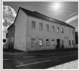
Unser Vereinshaus – Blickrichtung Nünchritzer Straße