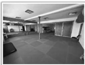
Unser top ausgestatteter Sportsraum mit angemessenem Fitnessbereich