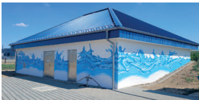
Das neue Bedienegebäude am Hochbehälter in Riesa-Weida.

Zur langfristigen Sicherung einer stabilen Trinkwasserversorgung wurde das in die Jahre gekommene Schiebergebäude des Hochbehälters Riesa-Weida durch einen Neubau ersetzt. Der Hochbehälter in Weida ist mit einem Nenninhalt von 10.000 m 3 der größte Behälter der WRG und der zentrale Punkt im Verbundsystem des Fernleitungsnetzes zwischen Riesa, Großenhain und Lommatzsch.