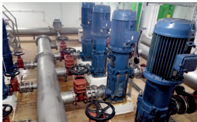
Die Druckerhöhungsanlage Großenhain-West vor dem Umbau.

Über die DEA Großenhain-West werden das Stadtgebiet Großenhain sowie angrenzende Ortschaften versorgt. Im Bedarfsfall können der Hochbehälter Kupferberg und die umliegenden Orte direkt gespeist werden. Die Anlage, die aus dem Jahr 1997 stammt, ist in die Jahre gekommen. In Verbindung mit veränderten Fahrweisen sind neue Pumpen notwendig. Zusätzlich soll die Anlage hydraulisch an den Stand der Technik angepasst werden. Die Umsetzung dieser Maßnahme ist noch für dieses Jahr geplant und kostet rund 90.000 Euro.