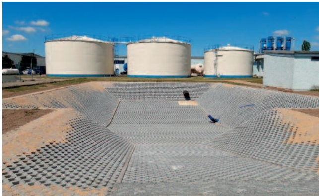
Ein Schlammbecken wurde in diesem Jahr bereits saniert.

Die Schlammbecken im Wasserwerk Fichtenberg sind mehr als 50 Jahre alt und weisen mittlerweile einen sehr schlechten baulichen Zustand auf. In den Schlammbecken wird das Spülwasser mit den Filterspülrückständen aus den Sandfiltern und Aktivkohlefiltern auf natürliche Weise entwässert und zwischengelagert. Zur Sicherstellung der Aufbereitung sind beide Schlammbecken instand zu setzen. Die Fertigstellung des rechten Schlammbeckens erfolgte bereits in diesem Jahr. Bis zum Jahresende wird das zweite Becken saniert. Geplant sind für diese Maßnahme 117.000 Euro.